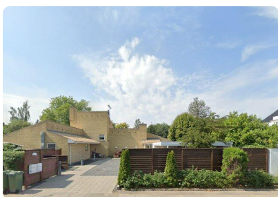
128m 2 ejerlejlighed Eggersvej 23A, 2900 Hellerup Solgt 12. jan. '18 for 5.495.000 kr.