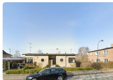
107m 2 bolig Ellemosevej 59, 2900 Hellerup Solgt 11. aug. '20 for 5.495.000 kr.