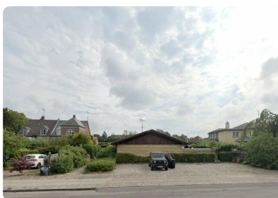
73m 2 ejerlejlighed Taffelbays Alle 2D, 2900 Hellerup Solgt 27. may. '19 for 4.050.000 kr.