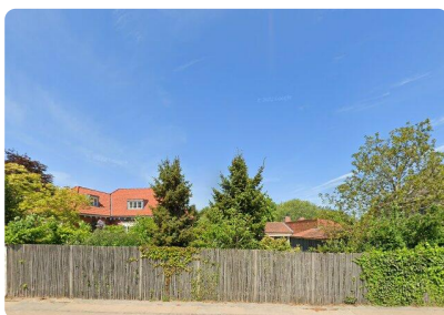
105m 2 ejerlejlighed Tuborgvej 76D, 2900 Hellerup Solgt 1. dec. '18 for 3.900.000 kr.